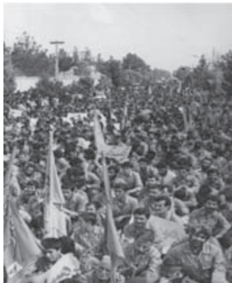
شکل ۶-۴- اعزام نیروهای مردمی از استان

روزنامه‌ها نوشتند: گروه کثیری از نیروهای تازه نفس رزمی طی یک اقدام سریع و فوق‌العاده از استان سمنان راهی جبهه‌های خون و شرف میهن اسلامی شدند.