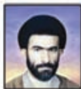
شهید سید ابوالقاسم حاجی‌الکاسبی مسئول لجستیک و پشتیبانی کمک‌های انسانی