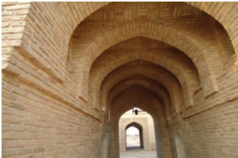
شکل ۲-۳- معماری سنتی (طاق‌های آجری) در سمنان