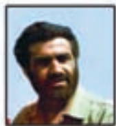
شهید حسن نوری جانشین مسئول کل جبهه