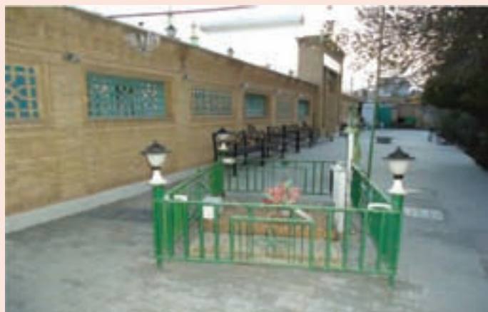
شکل ۱۳-۴- آرامگاه حاج ملا علی حکیم الهی در شهر سمنان

زادگاه خویش مراجعت کردند و با تدریس و برگزاری مراسم نماز جماعت و جمعه مردم را هدایت می کردند. ایشان به لحاظ ساده زیستی و زهد و تقوا در میان عامه مردم جایگاه ویژه‌ای داشت و در علم و حکمت سرآمد روزگار خویش بود. در حکمت، نجوم، در علوم الهی و مسائل اجتماعی نظریه‌های بسیار روشنی را ابراز می کرد. این حکیم فرزانه ۲۵ اثر داشته که در پی وقوع سیل از بین رفته است. در سال ۱۳۳۳ هجری قمری در سمنان رحلت کرد. آرامگاه او در ضلع غربی میدان امام خمینی (ره) سمنان واقع شده است.