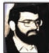
شهید سید... جانشین مسئول کل جبهه