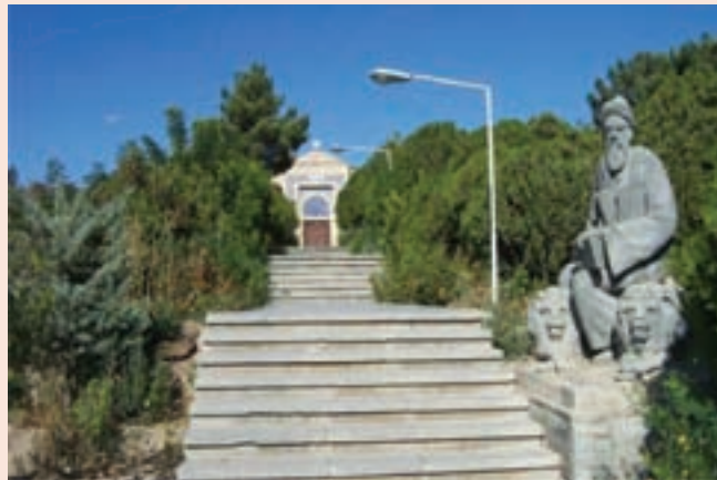
شکل ۱۲-۴- آرامگاه عارف نامی شیخ ابوالحسن خرقانی روستای خرقان در شهرستان شاهرود

منسوب است، نورالعلوم است. این عارف بزرگ در سال ۴۲۵ هجری قمری در هفتاد و سه سالگی در روستای خرقان بسطام دیده از جهان فرو بست.