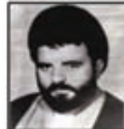
شهید سید احمد لوی فرمانده کمک‌های انسانی