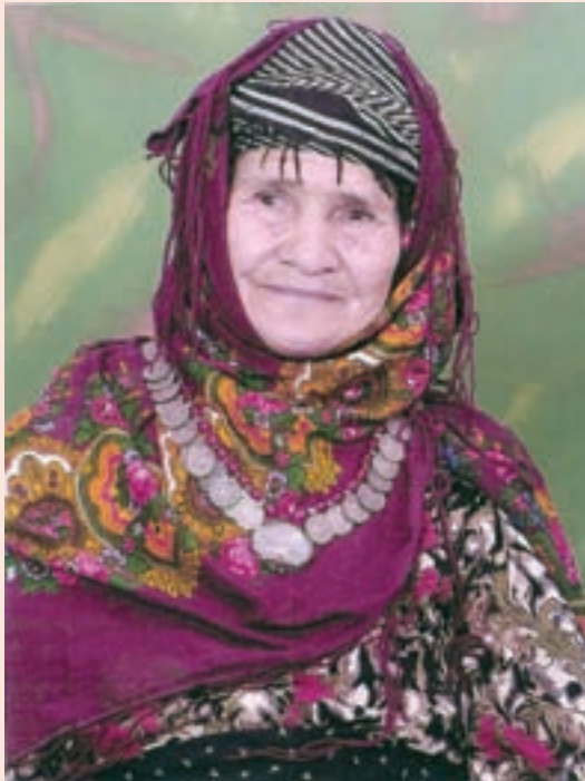
شکل ۵-۳- پوشش لباس زنان عشایر الیکایی در شهرستان گرمسار