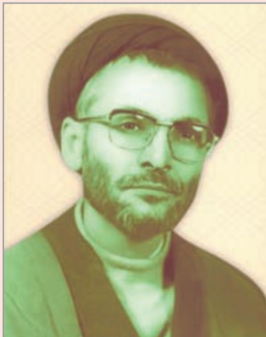
شکل ۱۴-۴- شهید حجت‌الاسلام سید کاظم موسوی

این شاعر طبیعت‌سرا و تیزهوش به زبان‌های فارسی و عربی تسلط داشته و از شعرای عرب نیز در اشعار خود تأثیر پذیرفت. این شاعر پرآوازه ادبیات ایران در سال ۴۳۲ هجری قمری از دنیا رفت.