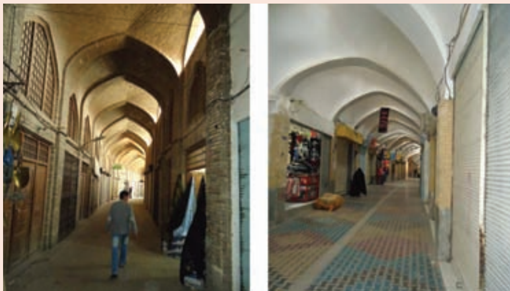
شکل ۴-۵. بازار سرپوشیده سمنان

در دوره مشروطه، در اثر ستم‌ها و بیدادگری‌های حکومت، مردم آزاده ایالت قومس به رهبری شادروان سید ابوظالب حسینی شریعت پناهی، عارف وارسته و دانشمند بزرگ این منطقه بر ضد حکومت خودکامه قاجار قیام کردند.