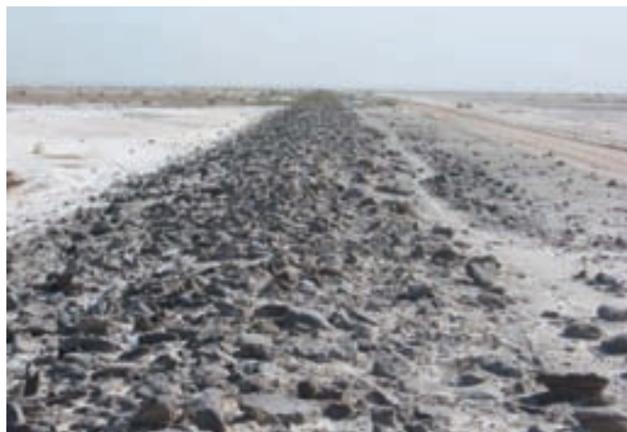
شکل ۲-۴- جاده سنگ فرش جهت عبور کاروان‌ها در جنوب گرمسار