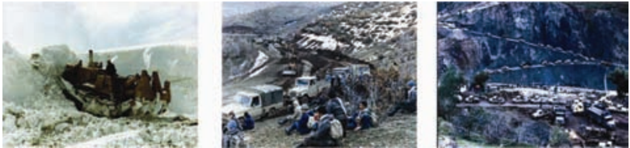
شکل ۷-۴- پشتیبانی جهاد سازندگی از جبهه‌های نبرد حق علیه باطل

احداث خاکریز، نصب پل، احداث جاده، بازسازی روستاها و شهرهای آسیب دیده به ویژه احداث جاده استراتژیک در عملیات طریق القدس در منطقه بستان و جاده سید الشهداء (ع) در جزیره مجنون از موارد مهم آن است. همچنین مدیریت قرارگاه حمزه سید الشهداء (ع) بر عهده جهاد استان بوده است که پذیرای ۱۲۰۰۰ نفر از رزمندگان جهادی استان و ۱۳۰۰۰ نفر از سایر استان‌ها بوده است. در مجموع تعداد ۱۱۳ نفر از رزمندگان جهاد سازندگی در طول ۸ سال دفاع مقدس به شهادت رسیدند.