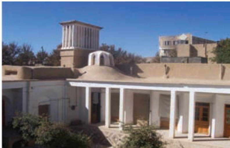
شکل ۳-۴- فضاهای زیستی اندرونی، سازگار با محیط و بادگیر در شاهرود