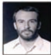
شهید حاج... مسئول لجستیک و پشتیبانی کمک‌های انسانی