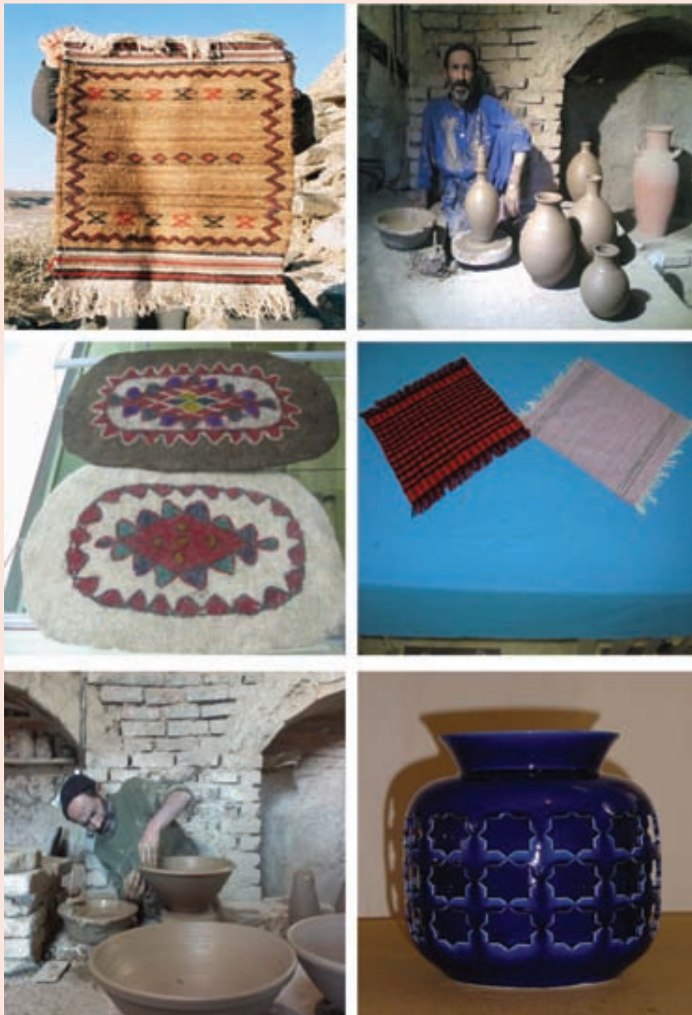
شکل ۷-۳- نمونه‌هایی از صنایع دستی استان سمنان