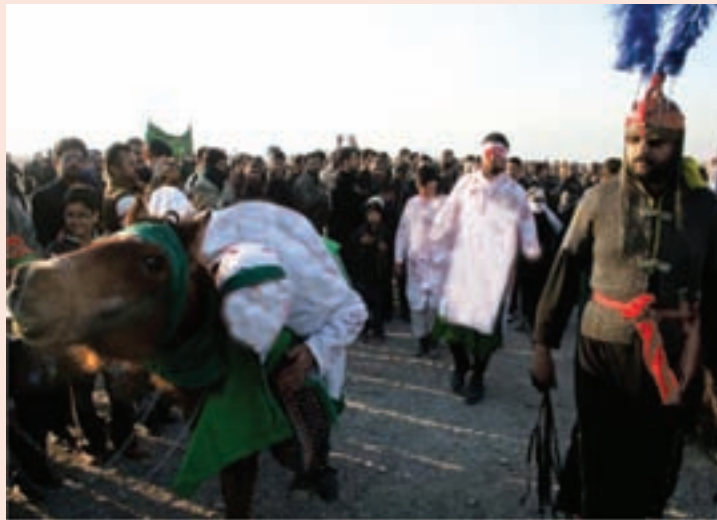
شکل ۱-۳- مراسم تعزیه خوانی ایام محرم در استان