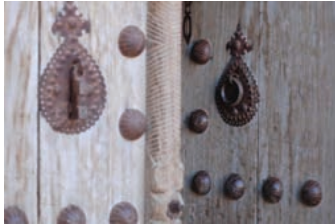
شکل ۳-۳- نقوش روی در و انواع کوبه