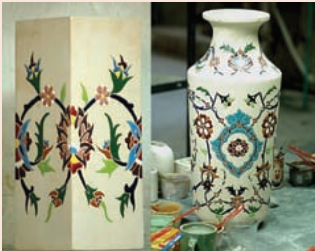
شکل ۳-۶- دو نمونه از صنایع دستی استان

گلیم بافی : گلیم به عنوان نخستین زیرانداز بشر، دارای سابقه بسیار طولانی است. گلیم که در مقایسه با قالی دارای شیوه بافتی آسان‌تر است و به همان نسبت قیمت ارزان‌تری دارد، هنری در انحصار روستاییان و عشایر به حساب می‌آید. بافت گلیم خاص دختران و زنان خانه‌دار است و همین هنرمندان بی نام و بی ادعا هستند که به کمک سرپنجه‌های خویش نقوشی اعجاب‌انگیز می‌آفرینند. روستاهای شهرستان گرمسار، سمنان، مهدی شهر، دامغان و شاهرود از مراکز تولید گلیم در استان به‌شمار می‌آیند.