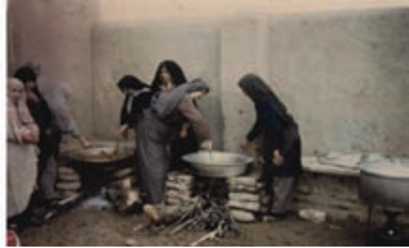
شکل ۸-۴. طرح قلمک‌ها و جمع‌آوری و ارسال کمک‌های مردمی به جبهه‌های نبرد حق علیه باطل

۸۵۰۰۰ قلمک در ۴ ماه در سال ۱۳۶۵ برای جبهه‌ها بوده است. دانش‌آموزان با تقدیم ۶۳۰ شهید گرانقدر آگاهی و بصیرت خود را به جامعه نشان دادند.