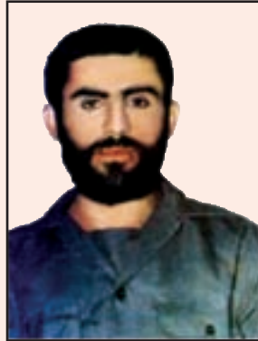
شهید جهان نصیری (گچساران)