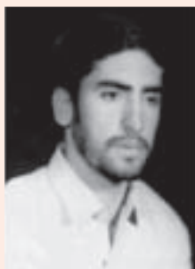
شهید سیده‌مت‌الله غریبی