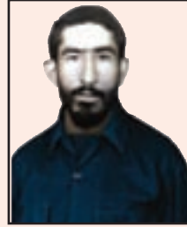
شهید نورالله یزدانپناه (لوداب)