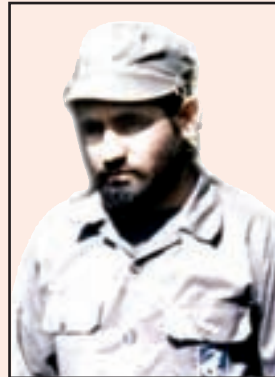
شهید فریبرز بناهی (دهدشت)