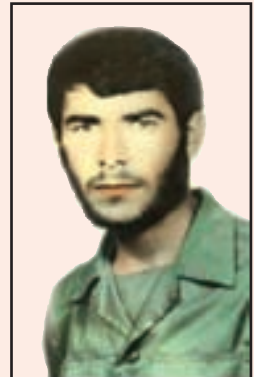
شهید عنایت الله بازگیر (دهدشت)