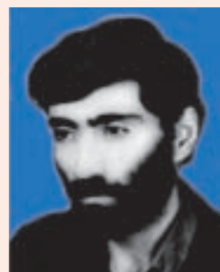
اولین معلم مبارز شهید استان کرامت‌الله ایزدپناه