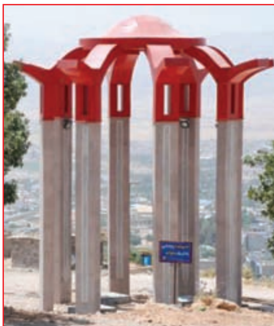
شکل ۹-۴- یادمان شهدای گمنام

تعداد شهدای استان: از افتخارات این استان در دفاع مقدس کسب مقام اول در اعزام نیرو از نظر جمعیت به جبهه‌های جنگ و اهداء ۱۸۰۰ شهید، ۳۳۰۰۰ رزمنده، ۱۳۰۰۰ هزار جانباز، ۳۱۰ نفر آزاده، که ۲۷۰ نفر از شهدا پاسدار، ۳۰۰ نفر سرباز و بقیه بسیجی بوده‌اند.