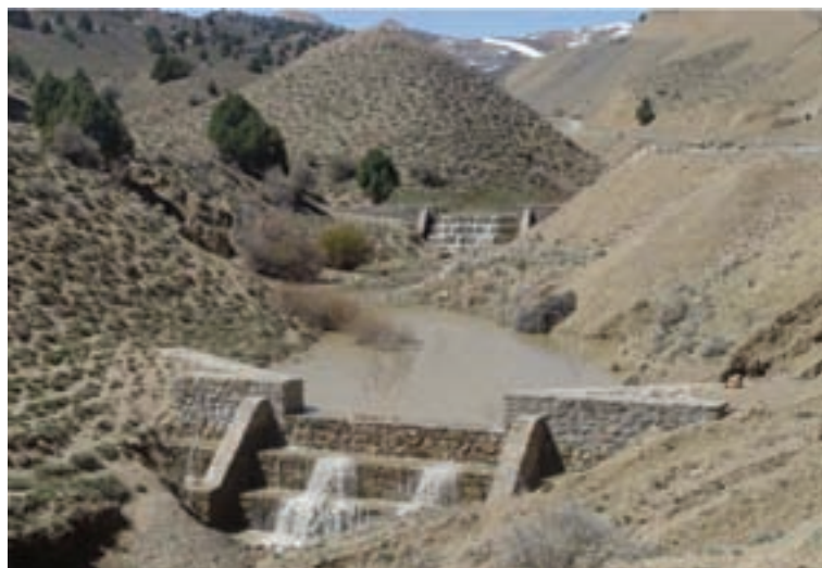
شکل ۴۷-۱ بند سنگی روستای فولاد محله در شهرستان مهدی شهر