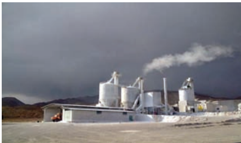
شکل ۴۹-۱- یکی از کارخانه‌های گچ در استان سمنان

گرچه آلودگی هوا در سطح استان به مرحله بحرانی نرسیده است، اما به دلیل رشد فعالیت‌های انسانی و رعایت نکردن مقررات زیست محیطی، در آینده شاهد آلودگی هوای بیشتری خواهیم بود.