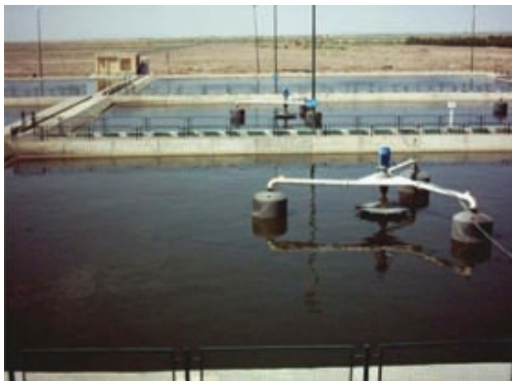
شکل ۵۱-۱- یکی از تصفیه‌خانه‌های فاضلاب شهرک‌های صنعتی استان