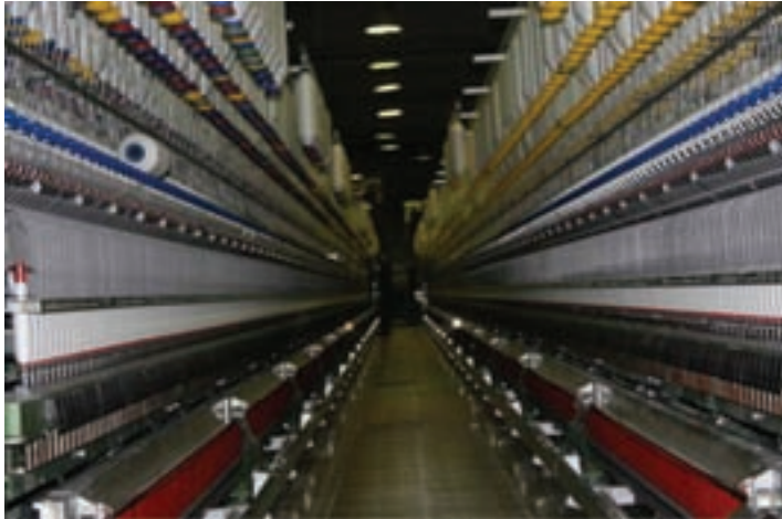
شکل ۵-۱- کارخانه ریسندگی شهرک صنعتی سمنان

چ) آلودگی آب : به دلیل محدودیت منابع آبی به خصوص رودهای دائمی و پایین بودن سطح آب‌های زیرزمینی، در حال حاضر مشکل آلودگی منابع آب در استان به طور جدی مطرح نیست. با این وصف منابع آبی اندک استان در معرض انواع آلودگی‌ها قرار دارند.