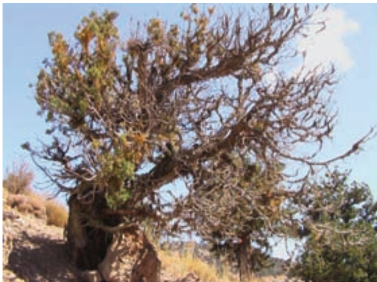
شکل ۴۶-۱- اثرات خشکسالی

اثرات خشکسالی در شهرها و روستاهای واقع در مجاورت کویر شدت بیشتری دارد که مهم‌ترین نواحی عبارت‌اند از : شهر و روستاهای منطقه بیارجمند، خوار و توران، روستاهای بخش میامی از شهرستان شاهرود، روستاهای جنوب شهرستان دامغان مانند : (معبد، یزدان آباد، معلمان، حسینیان، رشم و...) و روستاهای جنوب شهرستان‌های سمنان و گرمسار.