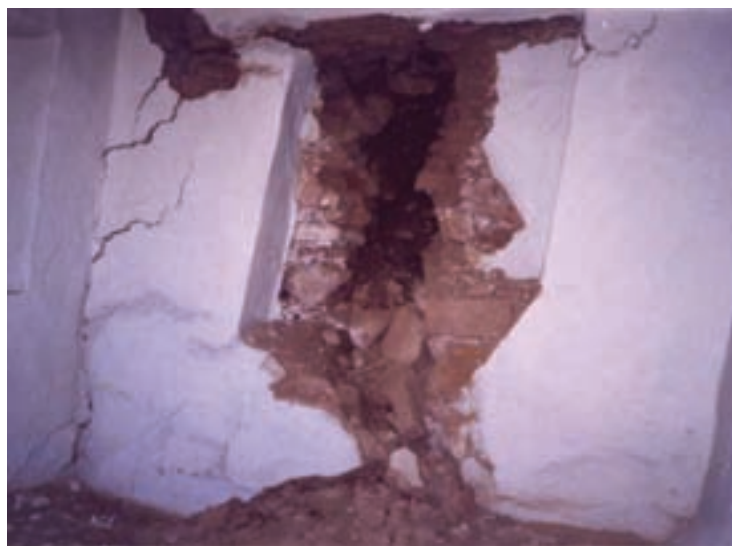
شکل ۴۸-۱- زمین لغزه در روستای بادله کوه، شهرستان دامغان