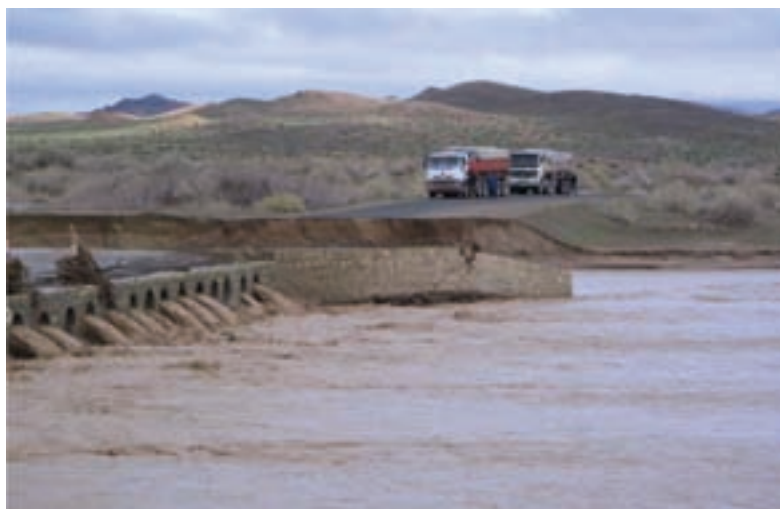
شکل ۴۵-۱- خسارت‌های ناشی از وقوع سیل در شهرستان شاهرود