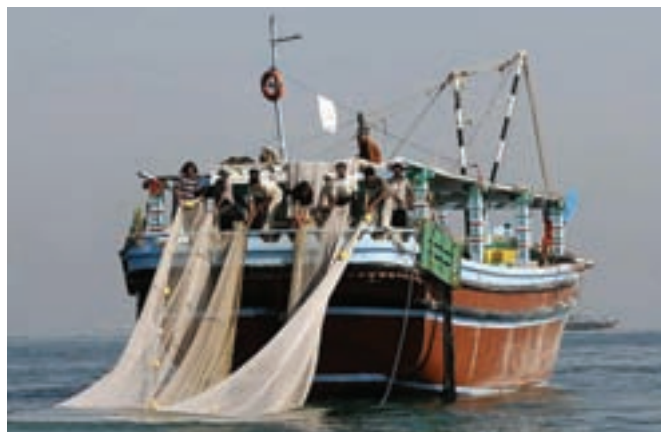
شکل ۱۰-۲- صیادی

مهمترین منابع درآمد جزیره نشینان: ویژگی‌های طبیعی جزایر، کمبود آب شیرین و عدم خاک حاصلخیز، نزدیکی آن‌ها به امارات متحده عربی و سهولت رفت و آمد موجب شده که شغل بیشتر جزیره نشینان خرید و فروش کالا، صیادی و دریانوردی باشد و همین عوامل باعث شده که در گذشته، گروهی از مردم این جزایر برای پیدا کردن کار مناسب و درآمد بیشتر جزیره را ترک نمایند؛ اما با اقداماتی که دولت در سال‌های اخیر انجام داده است مانند ایجاد مناطق آزاد تجاری، بازارچه‌های مرزی، دستگاه‌های آب شیرین‌کن، فروشگاه‌های زنجیره‌ای، بانک‌ها و غیره، تحولی در زندگی مردم زحمت‌کش بومی پیش آمده است که چشم‌انداز روشنی را در پیش‌رو خواهند داشت.