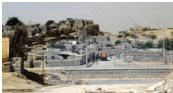
شکل ۱۱-۲- حاشیه‌نشینی در بندرعباس