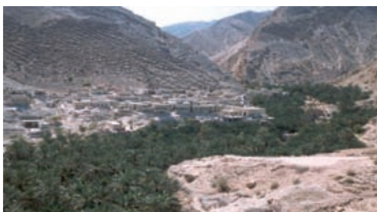
شکل ۲-۵- شکل روستای طولی و متمرکز