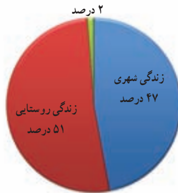
شکل ۲-۲- نمودار شیوه زندگی در هرمزگان در سال ۱۳۸۵ برحسب درصد

دانش آموزان عزیز! آیا می‌دانید که مردم استان ما به چه شیوه‌هایی زندگی می‌کنند؟ در کشور ما ایران سه شیوه زندگی کوچ‌نشینی، روستایی و شهری وجود دارد و هر سه شیوه زندگی در استان هرمزگان دیده می‌شود که در این درس بیشتر با آن‌ها آشنا خواهید شد.