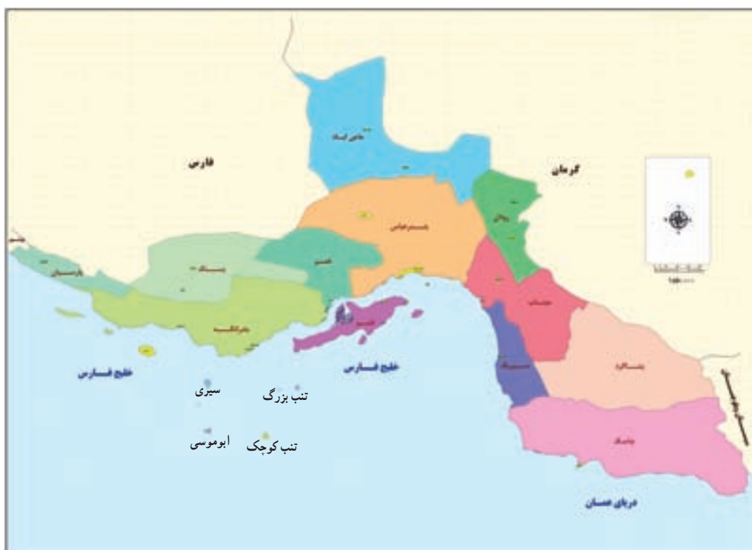
شکل ۱-۲- نقشه تقسیمات سیاسی استان هرمزگان به تفکیک شهرستان

استان هرمزگان بر اساس آخرین تقسیمات کشوری دارای ۱۳ شهرستان، ۳۴ شهر، ۸۵ دهستان، ۳۸ بخش و ۲۹۱۰ آبادی و ۱۴ جزیره است.