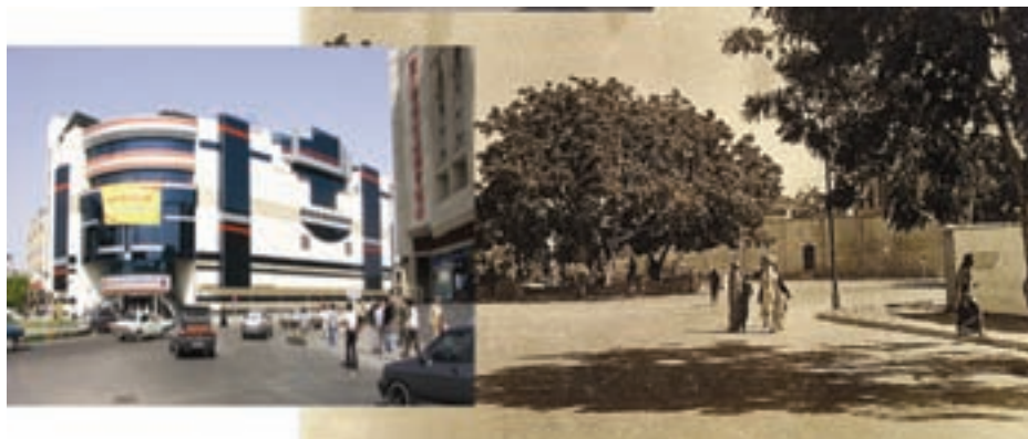
شکل ۶-۲- توسعه شهر بندرعباس (میدان ۱۷ شهریور)

وجود راه‌های ارتباطی دریایی، مناطق آزاد تجاری، ایجاد صنایع متعدد، در زمینه پالایشگاه‌های نفت و گاز، آلومینیوم، سیمان، ایجاد پایگاه‌های هوایی، دریایی، احداث راه آهن و ... از عوامل توسعه شهرنشینی در استان محسوب می‌شوند.