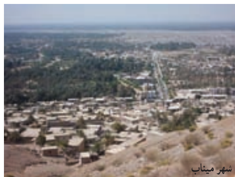
شکل ۲-۷- چشم اندازی از شهر اهوموسی، بندرعباس، میناب و چشم