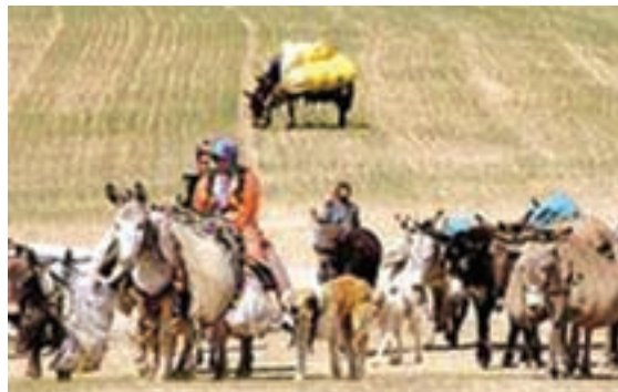
شکل ۲-۳- زندگی کوچ‌نشینی

استان هرمزگان به دلیل داشتن آب و هوای معتدل در فصل زمستان محل مناسبی برای قشلاق کوچ‌نشینان است. در استان هرمزگان تعداد عشایر کوچنده کم است و به حدود ۱۸۰۰۰ نفر می‌رسد که به دو صورت درون کوچ (منطقه بیلاقی آن‌ها داخل استان است) و برون کوچ (منطقه بیلاقی آن‌ها خارج از استان است) زندگی می‌کنند. بزرگترین ایل استان، ایل کوهشاهی است که بیلاق و قشلاق خود را در محدوده کوهشاه احمدی می‌گذرانند و دام‌های عشایر استان‌های کرمان و فارس نیز هنگام قشلاق از مراتع استان هرمزگان استفاده می‌کنند.