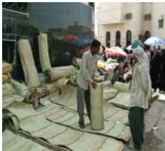
شکل ۲-۴- نمونه‌ای از منابع درآمد روستائیان استان