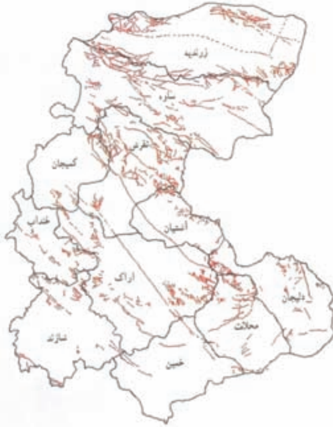
شکل ۳۴-۱- نقشه پراکندگی گسل‌های استان مرکزی