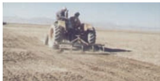
شکل ۲۹-۱- بذرکاری برای احیای مناطق بیابانی و کویری