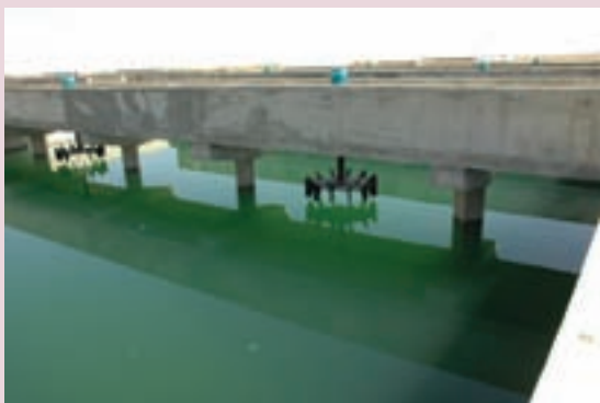
ب- تصفیه‌خانه لجن فعال در اراک

فرایند تصفیه لجن فعال: در این روش فاضلاب‌ها با استفاده از هوادهی و برگشت لجن به وسیله دستگاه‌های الکترومکانیکال تصفیه می‌شوند. زمان تصفیه فاضلاب در روش لجن فعال بین ۲ تا ۶ ساعت می‌باشد. این روش تصفیه در تمام شرایط آب و هوایی امکان‌پذیر است. فضای مورد نیاز برای ساخت تصفیه‌خانه لجن فعال کم است.