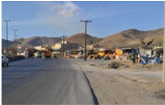
شکل ۴۲-۱- آلودگی بصری (محور اراک - سنجان)

آلودگی بصری مفهومی جدید است که البته از دیر باز وجود داشته است. در سطح شهرهای استان مرکزی عناصر بصری ناهمگون با محیط پیرامون و یا انباشت تعداد زیادی از این عناصر در یک منطقه دیده می‌شود؛ بیلبردها، تخریب‌های طبیعی، دکل‌های فشار قوی برق و... نمونه‌هایی از این موارد محسوب می‌شوند. از دلایل ایجاد این آلودگی در شهر اراک تقدم شهرنشینی بر شهرسازی، مهاجرت روستاییان و عدم رعایت حقوق شهروندی توسط عده‌ای از شهرنشینان است.