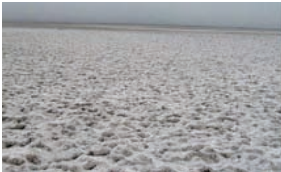
شکل ۳۳-۱- کویر میقان اراک