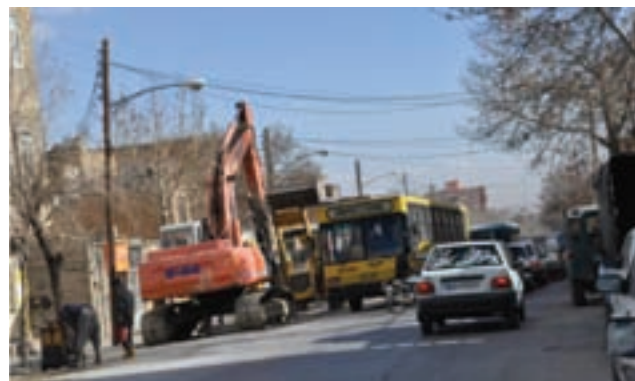
شکل ۴۳-۱- آلودگی صوتی در شهر اراک

آلودگی صوتی به هرگونه صدایی گفته می‌شود که از منابع صوتی تولید و باعث ایجاد آزرده‌گی در انسان می‌شود. واحد اندازه‌گیری صوت «دسی بل» است. ایجاد فضای سبز در محدوده شهرها، امتداد خیابان‌ها و جاده‌ها، از راه‌های کنترل آلودگی صوتی است. منابع تولید کننده آلودگی صوتی در سطح استان: برخی از این منابع عبارت‌اند از: کارخانجات، کارهای ساختمانی، صدای ناشی از سیستم‌های تهویه منازل، صدای ناشی از حمل و نقل، بوق اتومبیل، ضبط یا رادیوی وسایل نقلیه، ترمز ناگهانی، تصادفات، صدای آگروزها، اورژانس، آژیرهای خطر، دزدگیر، ساخت و ساز، ماشین آلات صنعتی، خودروهای باری، موتورها، کارگاه‌های پراکنده در سطح شهر و قرار گرفتن آن‌ها در مکان‌های نامناسب و وسایل خانگی.