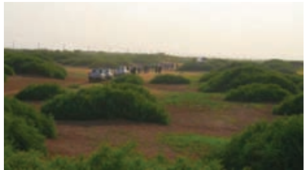
شکل ۳۲-۱- چشم اندازی از گیاه قره داغ کویر میقان