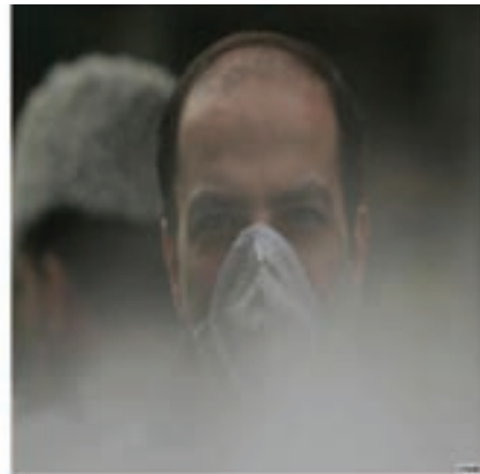
شکل ۳۷-۱- آلودگی هوا در شهر اراک (آذرماه ۸۹)