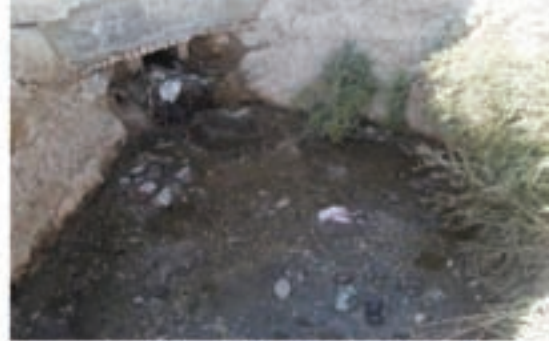
شکل ۳۹-۱- آلودگی آب رودها