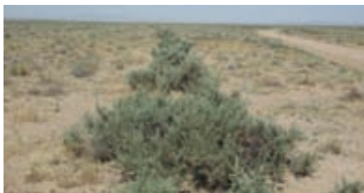
شکل ۳۰-۱- کاشت گیاه آتریپلکس

به منظور جلوگیری از روند بیابانی شدن زمین‌ها و سامان بخشیدن به بهره‌برداری از اراضی بیابانی و کویری و بهبود آنها اداره کل منابع طبیعی استان اقدام به بیابان‌زدایی کرده است؛ مهم‌ترین این اقدامات عبارت‌اند از: بوته‌کاری، بذرکاری، بذرپاشی، ایجاد بادشکن، قرق و حفاظت خاک.