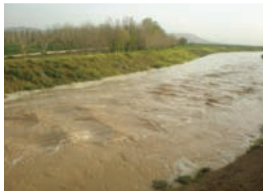
شکل ۳۵-۱- سیلاب در روستاهای اطراف اراک