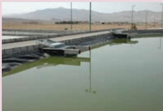
الف- برکه تثبیت در دلجان