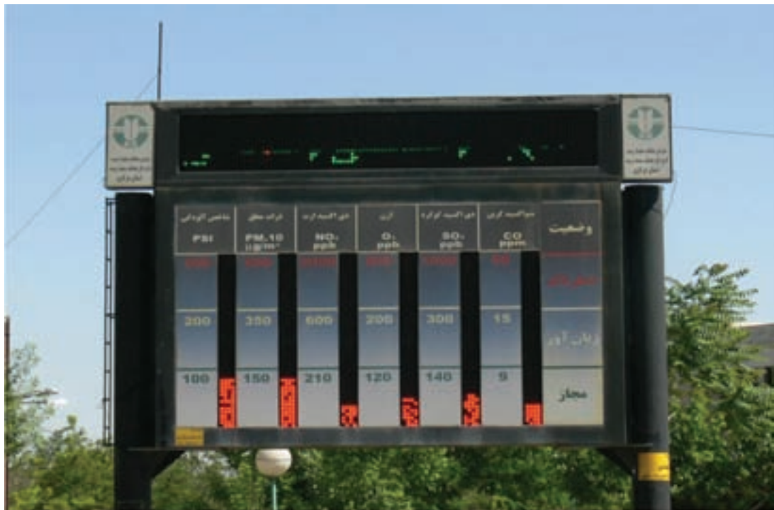
شکل ۳۸-۱- دستگاه نمایش دهنده آلودگی هوا در یکی از میدانی شهر اراک