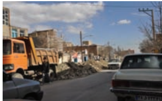
شکل ۴۱-۱- آلودگی بصری (یکی از محلات شهر اراک)