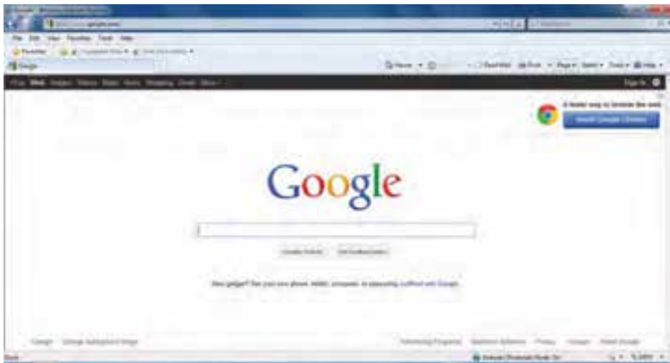
شکل ۱۱-۱۵ - صفحه اولیه پایگاه جستجوگر گوگل

برای جستجوی فارسی در پایگاه گوگل بهتر است از آدرس فارسی این پایگاه به نشانی http://www.google.com/intl/fa استفاده کنید.