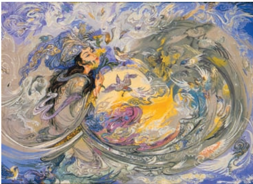
تصویر ۱۹-۲- تصویری از فرش‌های هنری

در بافت قالی روش‌های متنوعی به کار گرفته می‌شود. در بافت قالی‌های تصویری به کارگیری رنگ‌های متعدد و ترکیب آن‌ها با یکدیگر و همچنین تغییراتی که در گره‌ها ایجاد می‌گردد دارای اهمیت بسیار است و به مهارت زیاد نیاز دارد. در بافت قالی‌های دو رویه نیز مهارت بسیاری لازم است. همچنین در برخی بافته‌ها با به کارگیری نخ‌های طلایی و نقره‌ای در متن بافته، نقوش را برجسته می‌یابند (صوف) قالی بافی در میان شهرها و روستاها و ایلات و عشایر بسیار گسترش و رواج دارد.