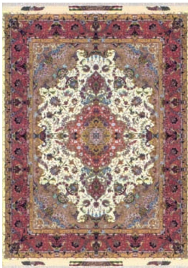
تصویر ۲۰-۲- قالی بافت تبریز

تصویر ۲۱-۲- قالی صوف بازمانده از قرن ۱۱ هجری، که در بافت آن از ابریشم و طلا و نقره استفاده شده است. محل نگهداری - موزه ملی ایران