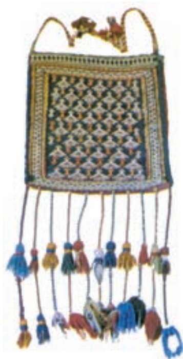
تصویر ۱۳-۲- چننه مانند کیف است و بر دوش حمل می شود.