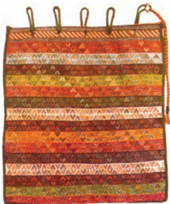
تصویر ۱۱-۲- جوال جهت حمل بار مورد استفاده قرار می‌گیرد. جوال سوزنی قشقایی

جوال - خورجین - چنته: دست‌بافت‌ها در میان ایلات و عشایر جنبه‌ی کاربردی دارد و آن‌ها هیچ‌گاه به صرف‌ترین به تولید این بافته‌ها اقدام نمی‌کنند از این رو با به‌کارگیری انواع روش‌های بافتی که در بافت گلیم ساده، سوزنی، جاجیم و... به‌کار می‌رود یا ترکیب بعضی از روش‌ها با یکدیگر وسایل دیگری چون جوال، خورجین، چنته و... نیز می‌بافند که متناسب با اندازه‌ی هر یک جهت حمل اشیاء بر پشت حیوان یا بر دوش انسان مورد استفاده قرار می‌گیرد (تصاویر ۱۱ و ۱۲ و ۱۳).