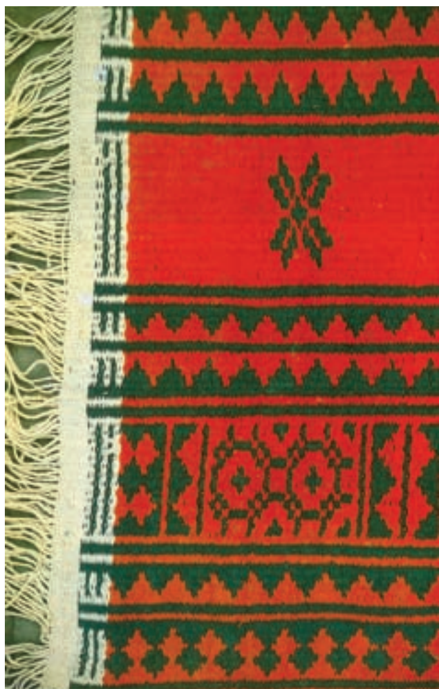
تصویر ۲-۴ — زیلوی میبد

زیلو: زیلو دست‌بافته‌ای است که با استفاده از تار و پود پنبه‌ای بر دارهای عمودی تولید می‌گردد. بافت این زیرانداز تابستانی در روستاها متداول است. زیلو نسبت به سایر دست‌بافته‌ها ضخیم و زمخت می‌باشد. این دست‌بافته دو رویه است و نقش یک طرف آن با طرف دیگر تفاوت دارد. پلاس ۱ : در بافت پلاس نیز، مانند بافت زیلو، از تار و پود پنبه‌ای استفاده می‌شود. با این تفاوت که در بافت پلاس از نخ‌های پنبه‌ای نامرغوب و پست استفاده می‌شود. پلاس بافته‌ای دو رویه، معمولاً بدون نقش و ضخیم و درشت می‌باشد.