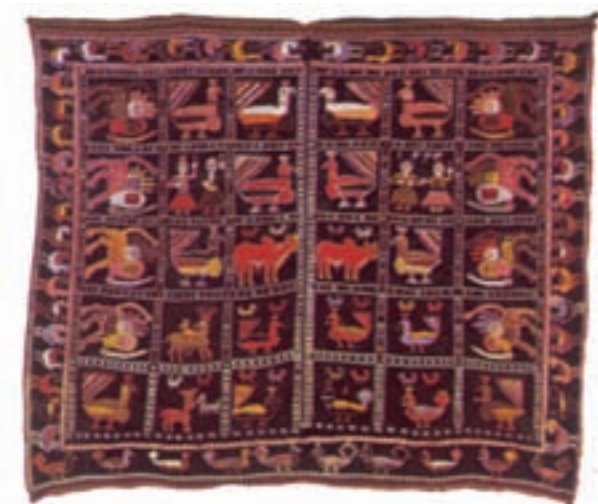
تصویر ۱۶-۲- قلیان‌دان جهت حمل و نگهداری قلیان استفاده می‌گردد.