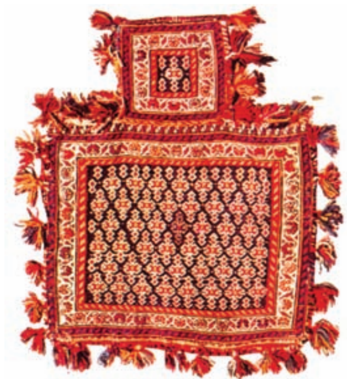
تصویر ۱۷-۲- نمک‌دان جهت حمل نمک یا ذخیره‌ی آن مورد استفاده قرار می‌گیرد.