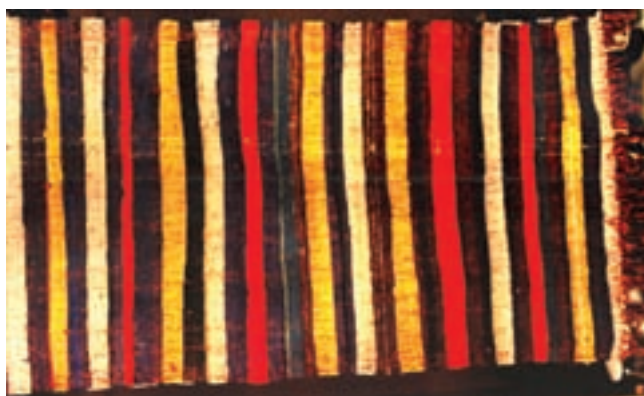
تصویر ۲-۵ — پلاس و دیتیل آن