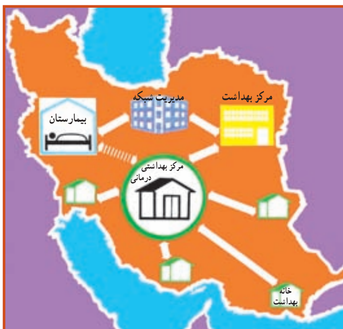
شکل ۴-۳- نظام عرضه خدمات بهداشتی

ز) مدیریت شبکه شهرستان: وظیفه هماهنگ‌سازی واحدهای مختلف بیمارستان و مرکز بهداشت شهرستان و نظارت بر فعالیت آنها را به عهده دارد، مدیر شبکه شهرستان، نماینده وزارت بهداشت، درمان و آموزش پزشکی در سطح شهرستان تلقی می‌شود. این نظام که اجزای آن در ارتباط و پیوستگی علمی و عملی با یکدیگر می‌باشند، اجراکننده برنامه‌های پیش‌بینی شده بهداشت و درمان کشور خواهد بود (شکل ۴-۳).