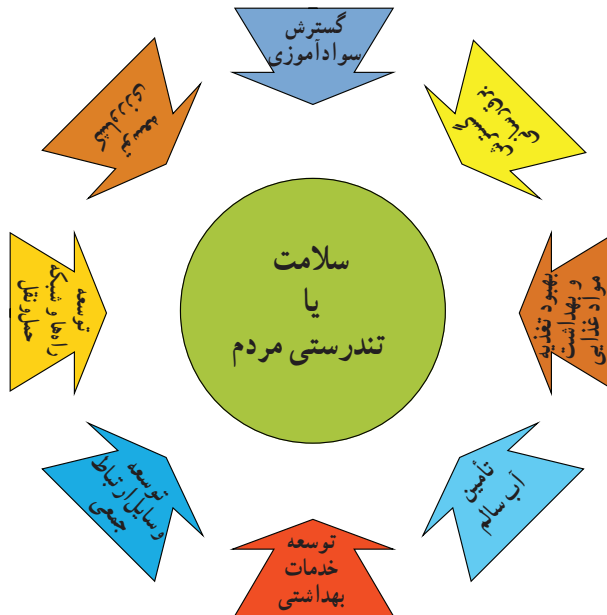
شکل ۲-۳- تجسم آنچه از هماهنگی بین بخشی برای تأمین سلامت مردم انتظار می‌رود.

ج) هماهنگی بین بخشی: ذکر این مطلب لازم است که سلامت افراد فقط با ارائه خدمات بهداشتی تأمین نمی‌شود بلکه سلامت مردم به آنچه می‌خورند، می‌نوشند، شغلی که در آن مشغولند، مسکن مناسب و بهداشتی، تفریحاتی که برای اوقات فراغت انتخاب می‌کنند و... بستگی دارد. پس در واقع باید بین بخش بهداشت و بخش‌های دیگر مانند کشاورزی، صنعت، حمل و نقل، آموزش و پرورش و وسایل ارتباط جمعی، همکاری وجود داشته باشد (شکل ۲-۳).