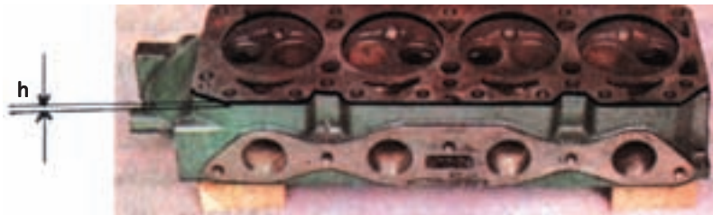
ضخامت سطح تراشیده شده h =

۱-۴-۲- تراش سر سیلندر: در این تعمیر، حجم مفید (V s ) تغییر نمی‌کند، بلکه حجم تراکم کم می‌شود.