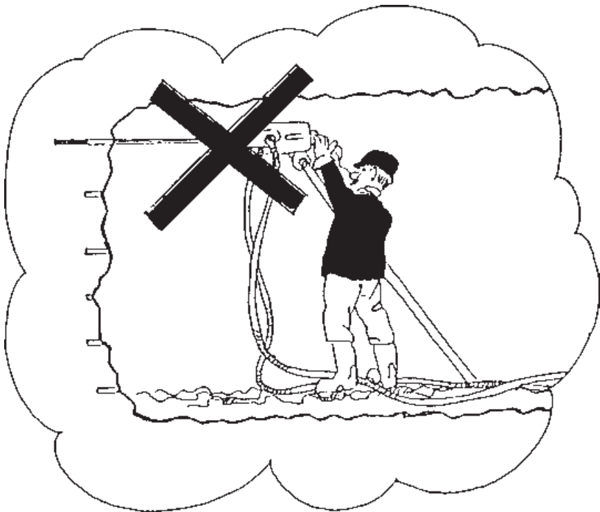
شکل ۱-۳- حفر چال در ته چال اکیداً ممنوع است.

لرزش‌ها و تکان‌های شدید، سرمته پیوسته روی سنگ جابجا می‌شود و مقداری تلاش لازم است تا سرمته در یک نقطه قرار گیرد و در سنگ نفوذ کند. به عبارت دیگر، سرمته در سنگ بند شود. البته بعد از نفوذ کردن سرمته در سنگ حفر چال به آسانی ادامه می‌یابد. لیکن ته چال برای شروع حفر چال، مشکلات بالا را ندارد و حفر چال از ابتدا به آسانی میسر می‌شود، لذا ممکن است کوهبر (کارگر حفاری) برای راحتی کار، چالزنی را از داخل ته چال‌ها شروع کند. بسیاری از اوقات پیش آمده که مقداری از ماده منفجره در ته چال باقی مانده و به محض برخورد سرمته به آن منفجر شده و موجب تلفات و خسارات مالی و جانی شده است. بنابراین همواره اکیداً توصیه می‌کنیم که از حفر چال در ته چال خودداری شود.