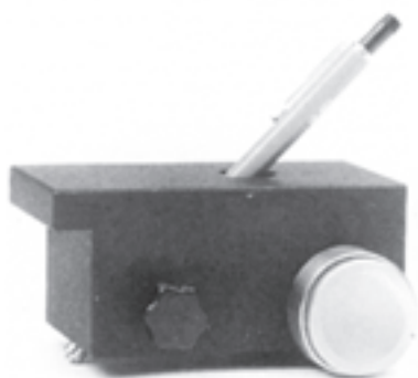
ب - سختی سنج مدادی

روش دیگری که برای تعیین سختی در آزمایشگاه‌های مجهز بکار می‌رود استفاده از آونگ‌های مخصوص است. در این روش سختی رنگ با استفاده از خاصیت تلف‌شدن انرژی در اثر نوسان آونگ مشخص می‌شود. طریقه‌ی تنظیم دستگاه و نحوه‌ی آزمایش در بروشورهای مربوطه منعکس شده است.