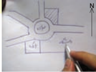
شکل ۱-۲. تهیه کروکی از یک منطقه