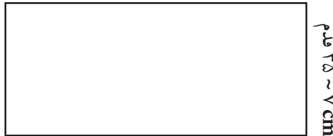
شکل ۲-۳. کروکی با ابعاد