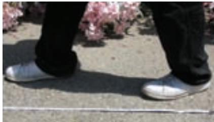
شکل ۲-۲. طول متوسط قدم نقشه بردار