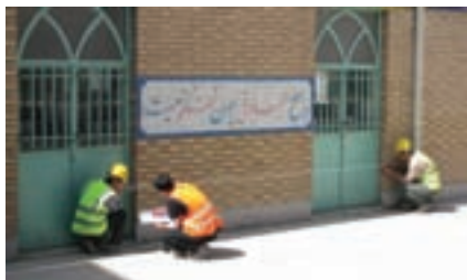
شکل ۲-۵. تهیه‌ی کروکی با متر

در هنگام ترسیم کروکی هر ۵ متر را معادل یک سانتی‌متر در نظر بگیرید.