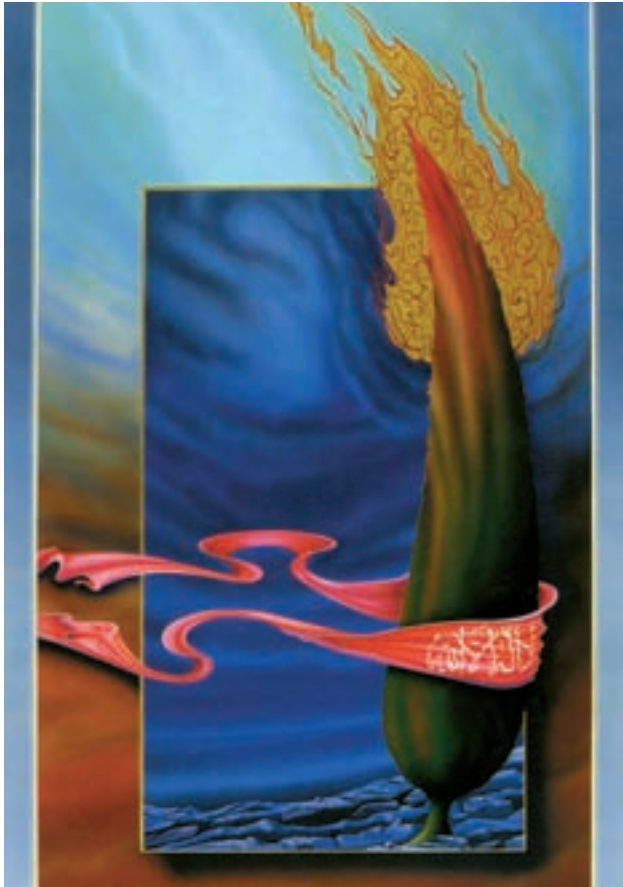
عروج، اثر مجید قادری