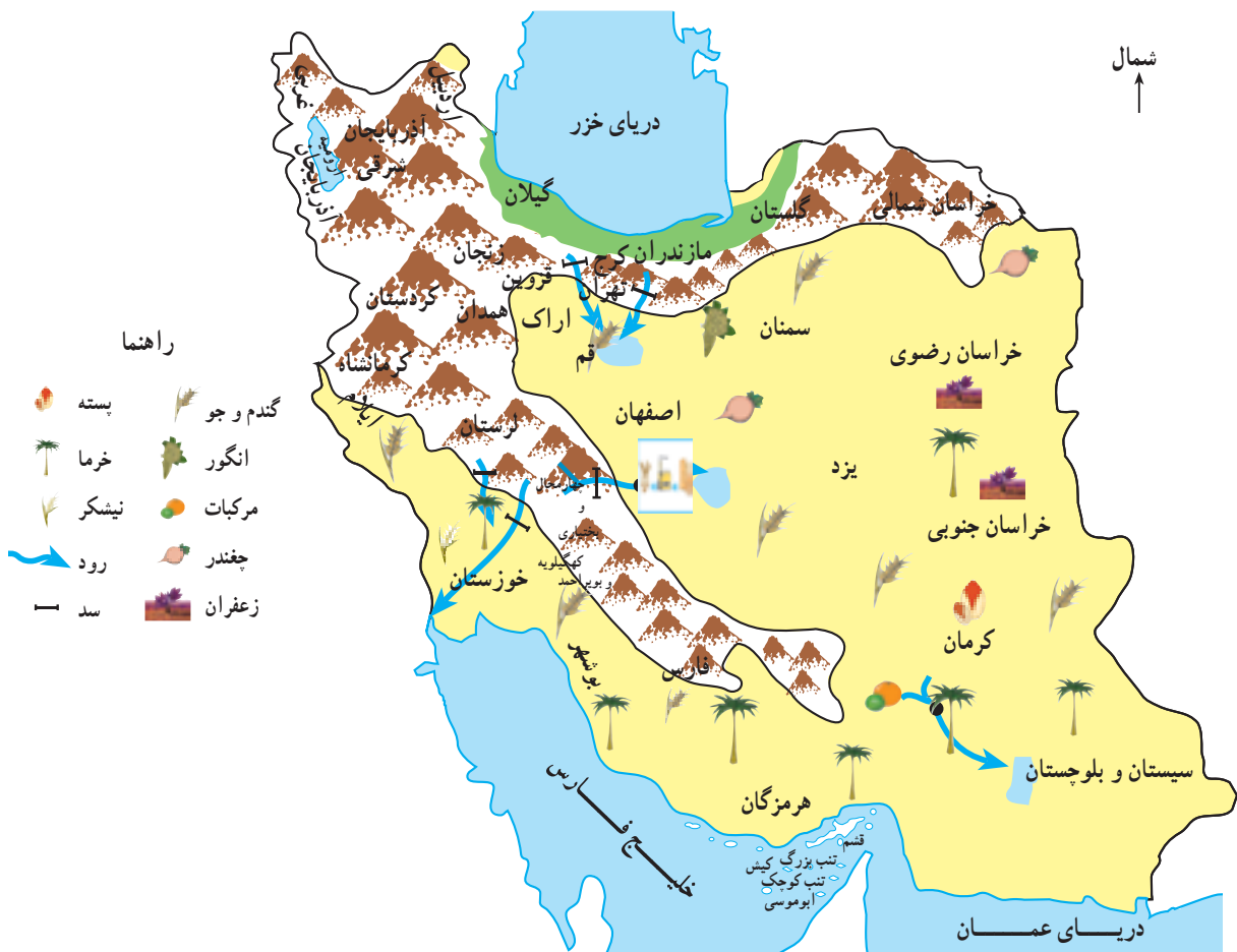
شکل ۳۹- نقشه‌ی پراکندگی محصولات کشاورزی ناحیه‌ی بیابانی و نیمه‌بیابانی

مهم ترین محصول کشاورزی ناحیه ی بیابانی و نیمه بیابانی گندم و جو است که بیش تر در کوهپایه ها کشت می شود ؛ زیرا نوع خاک کوهپایه ها، حاصلخیز و آبرفتی است و این ناحیه، برف و باران بیش تری دارد. پنبه، چغندر قند و نیشکر از گیاهان صنعتی این ناحیه اند. در ناحیه ی بیابانی و نیمه بیابانی اغلب محصولاتی رشد می کنند که با گرما و خشکی سازگاری زیادی دارند ؛ مانند : خرما و نیشکر. یکی از مهم ترین محصولات صادراتی ایران پسته است که بیش تر آن در استان کرمان تولید می شود. دام پروری در این ناحیه، به علت مساعد نبودن آب و هوا و کمبود چراگاه، با مشکلاتی روبه روست ؛ از این رو، شتر در بخش های بیابانی و گوسفند و بز در کوهپایه ها نگهداری می شود.