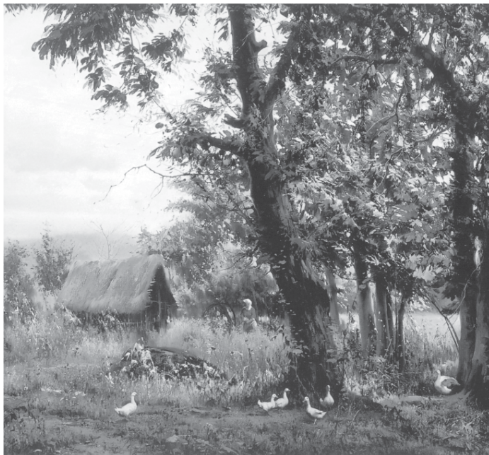
نقاشی آبرنگ اثر: رحیم نوه‌سی

۴) درباره‌ی تصویر زیر یک بند ادبی بنویسید.