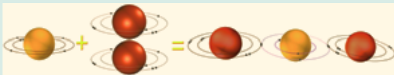
مولکول دی‌اکسید کربن ( CO_2 ) دو اتم اکسیژن ( O ) یک اتم کربن ( C )

۳- موجودات زنده از جمله انسان نیازمند ماده‌ای به نام «قند» هستند تا انرژی خود را تأمین کنند و زنده بمانند. این ماده از ترکیب آب و دی‌اکسید کربن و به کمک خورشید در گیاه ایجاد می‌شود. گیاه، خود از آن استفاده می‌کند و حیوان و انسان را هم از آن بهره‌مند می‌سازد و بدین ترتیب رشد موجودات زنده ادامه می‌یابد. ۱